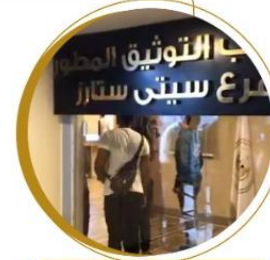
فرع سيتي ستارز