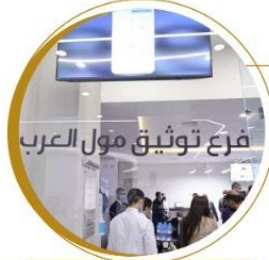
فرع مول العرب